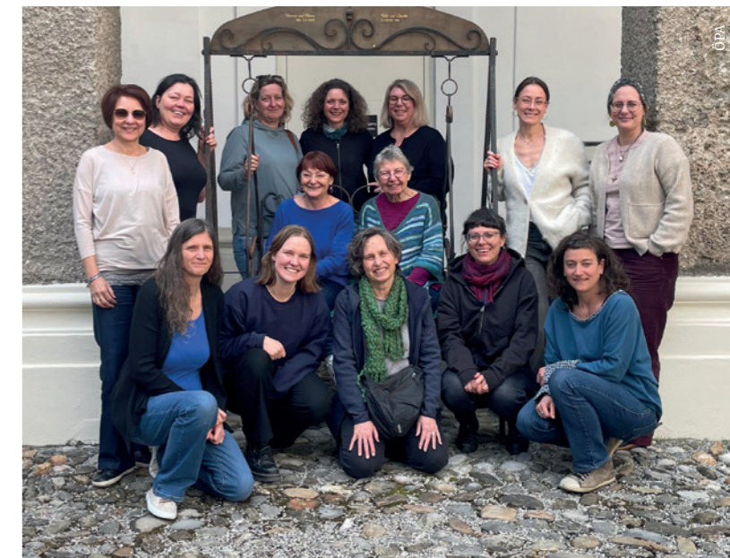
Vernetzungstreffen der ÖPA-Mitgliederorganisationen: Der Austausch von Erfahrungen aus der täglichen Arbeit mit Alleinerziehenden fließt in die politische Arbeit der ÖPA ein.

oepa.or.at/pressemitteilung-zum-unterstuetzungsfonds-fuer-alleinerziehende/