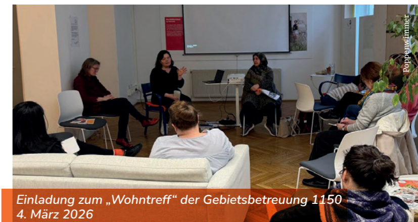
Einladung zum „Wohntreff“ der Gebietsbetreuung 1150 4. März 2026

Im Anschluss an die Präsentation kam es zu einem hilfreichen und wertschätzenden Informationsaustausch mit den sehr interessierten Teilnehmer*innen. Sichtbar wurde aber, wie stark strukturelle Bedingungen auf Frauen wirken und wie notwendig es ist, diese weiter aufzubrechen.